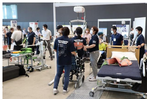
展示会場：ノーリフティングケア体験