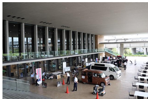
展示会場：福祉車両体験